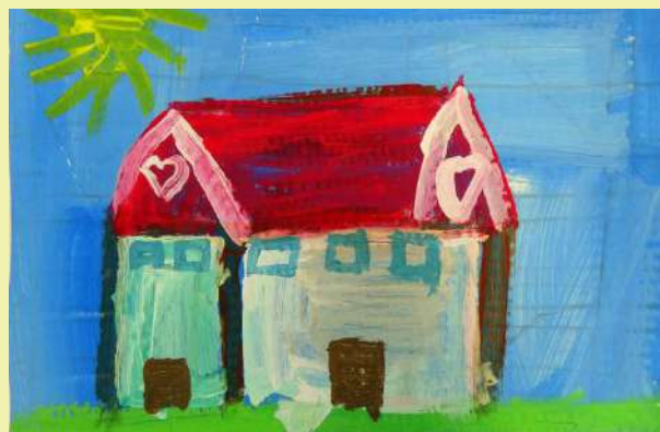
“Dom”, Zlatko, tempera