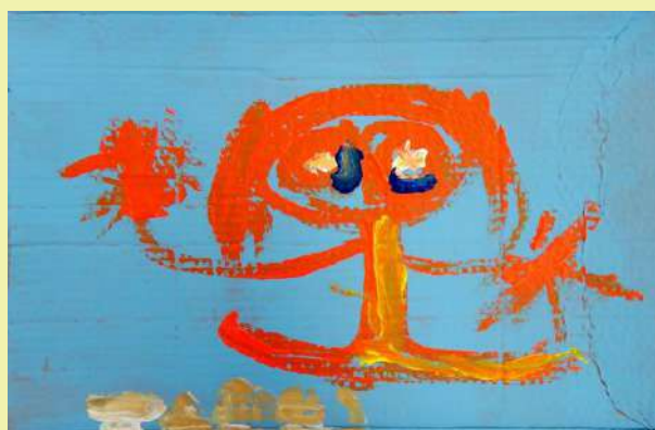
“Prijateljica”, Tadej, tempera