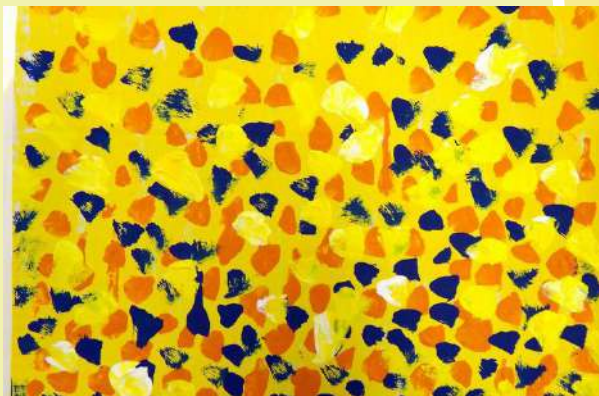
“Čebele in čmrlji”, Mateja, tempera