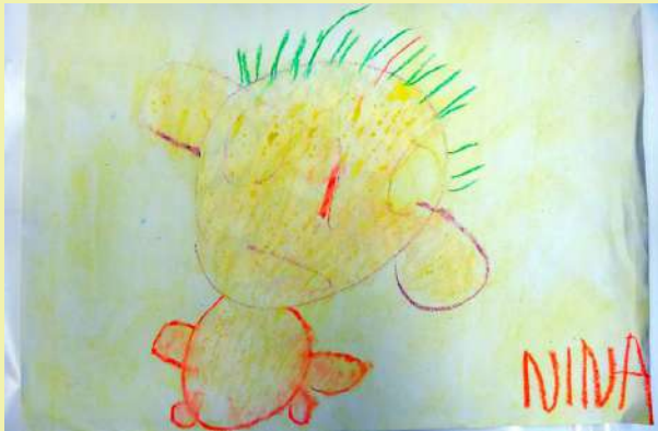
“Jaz”, Nina, risba