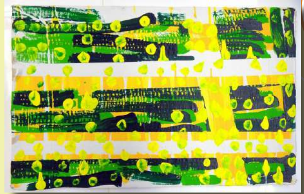
“Pomlad”, Mateja, akril