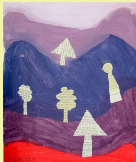
“Gozd”, Jasminko, tempera, kolaž