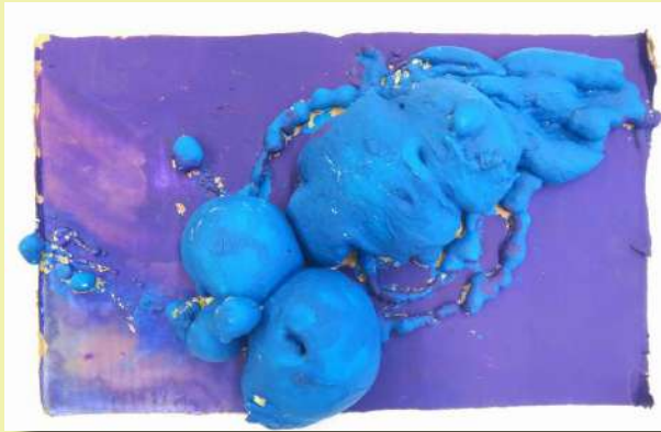
“Forme”, OVI V, plastika