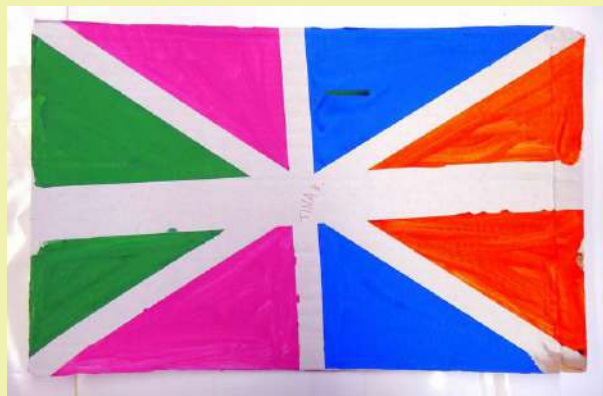
“Anglija”, Tina, tempera