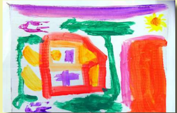
“Hiša”, Vid, tempera