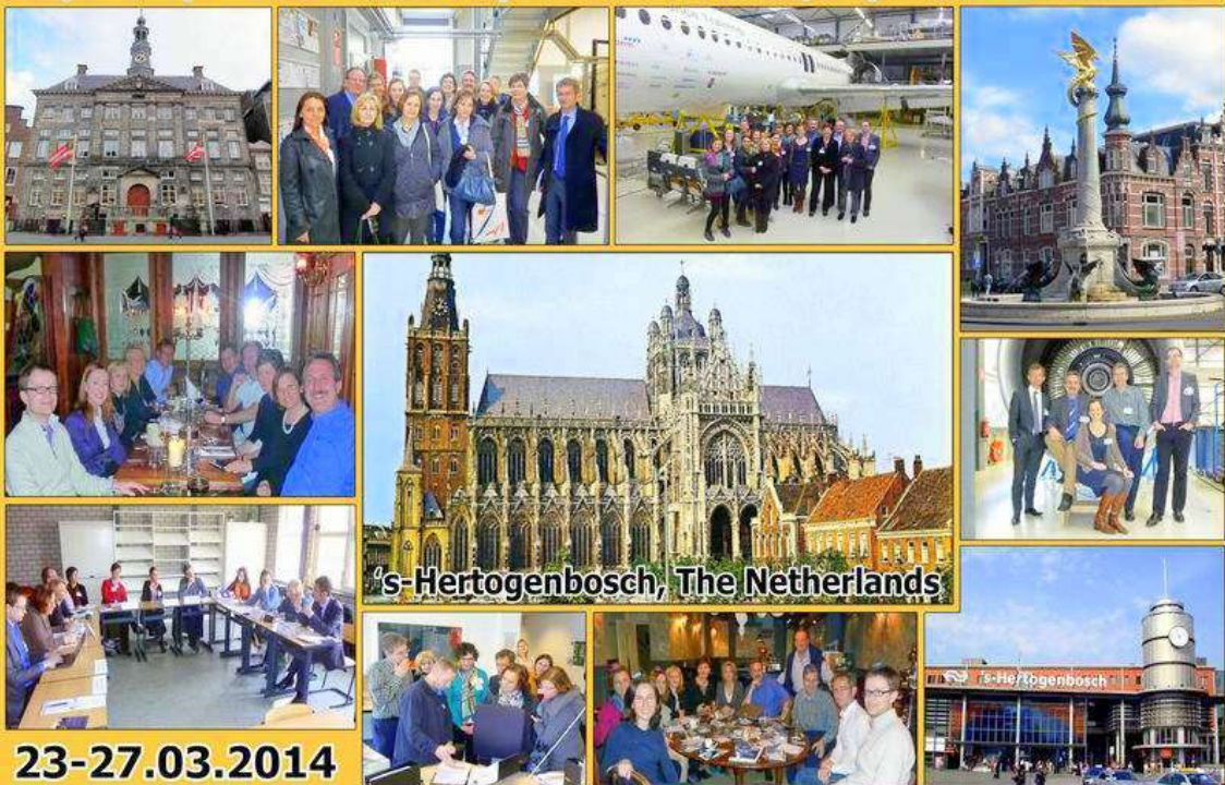
European Study visit: Towards better cooperation between schools, companies and local communities