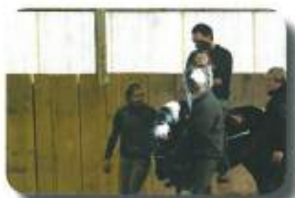
kar eden za drugim...