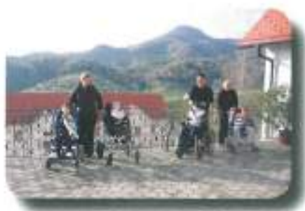
za 1. november smo obiskali sošolcev grobek