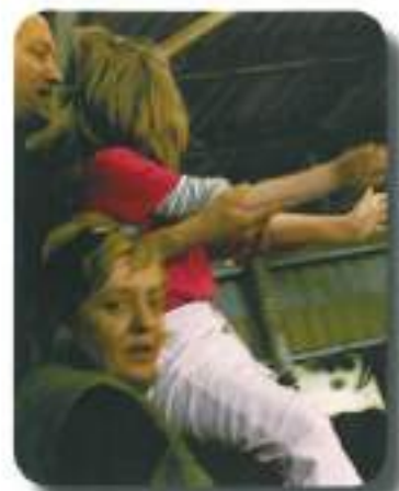
in iskali svoj začasni domek...