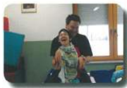
vse smo delali v 1. sobi...