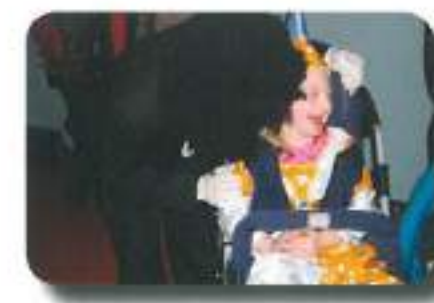
lepotica in zver sta pregnala sneg...