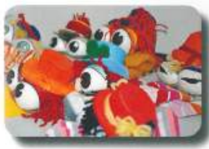
lutke so bile pripravljene...