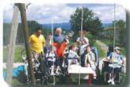
se sladkali z odličnimi tortami v prelepi okolici...