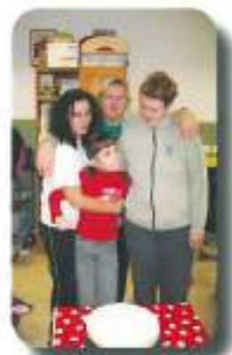
kjer smo celo leto praznovali naše rojstne dneve...