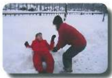
prišla je zima in z njo zimske radosti...