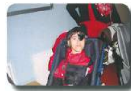
čisto pravi gusar je odgnal mraz...