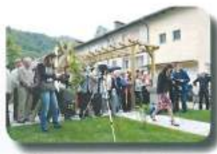
zbralo se je ogromno VIP gostov...