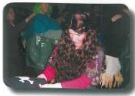
»flower power šefica« je posadila rožce...