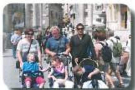
se potepali po Puli...in uživali pod slavolokom zmage