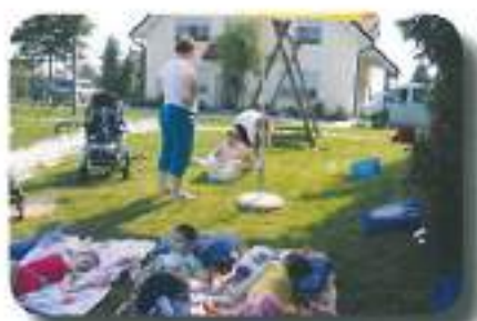
in se nastanili v prijetni hiški...