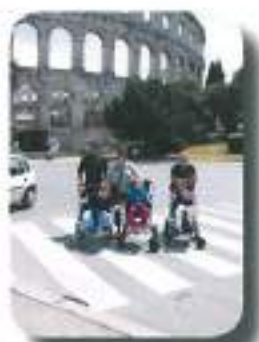
za las smo pobegnili pred levi v amfiteatru...