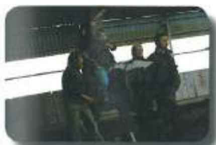
končno smo prijezdili na Jožefov hrib..