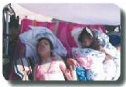
se sončili na plaži...