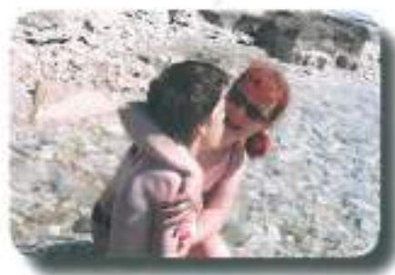
se namakali in hladili...