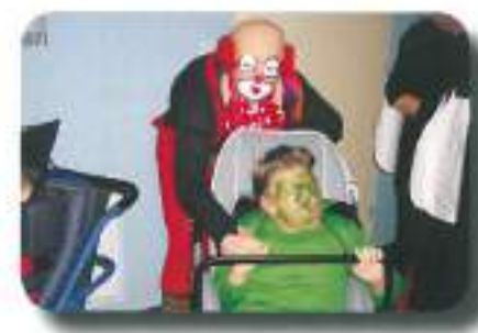
maškare so pregnale zimsko resnost in puščobo