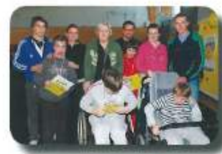
se udeležili državnih iger MATP na Igu