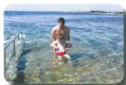
plavali v morju...