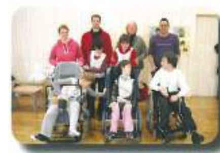
tekmovali na regijskih igrah MATP v Črni