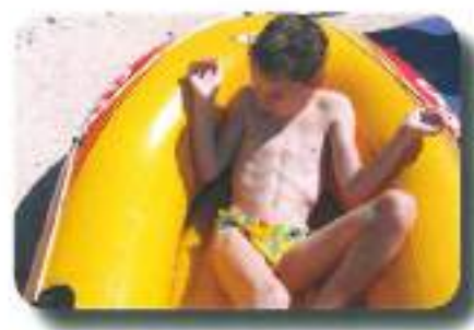
se vozili v čolnu...