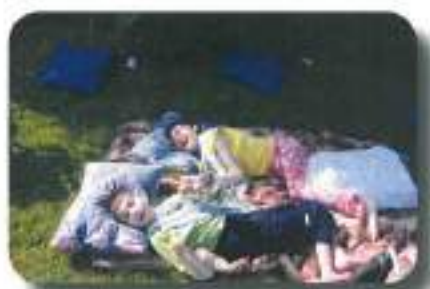
takole smo uživali na travni- ku...