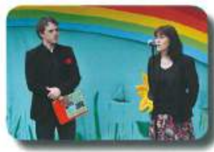
tudi naša mama nas je lepo nagovorila...