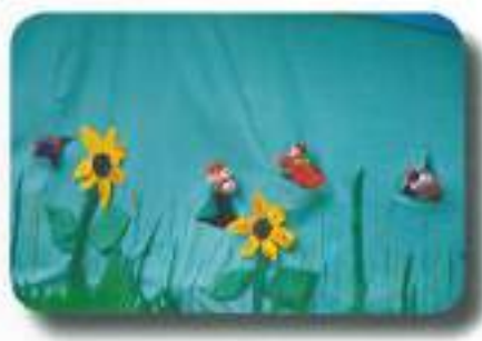
in že so oživele pod taktirko režiserke Anite Požin...