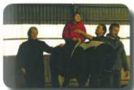
Odjezdili smo na divji zahod...