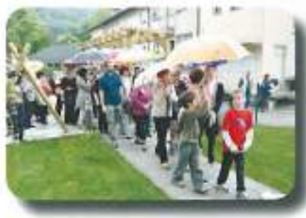
tik pred dežjem smo vstopili v nove prostore...