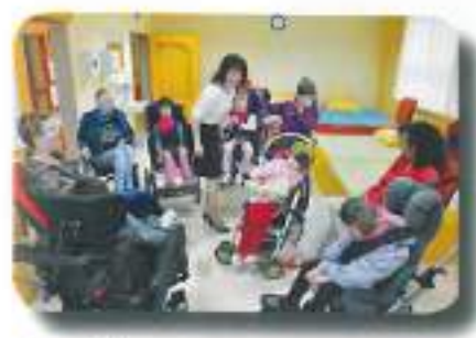
še zadnje priprave na otvoritveni »šov«...