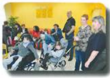
in se nastanili v dnevno... takšno je bilo naše 1. letno potovanje...