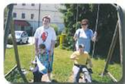
se guncali in gugali...