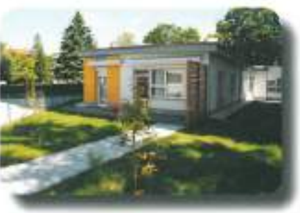
Ekipa Dnevnega centra Celje