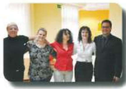
in vse je bilo nared za otvoritev...ekipa Dnevnega centra Celje