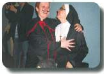
pa še poduhovili smo se na Sv. Jožefu...