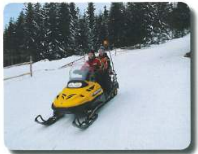
Vanja Sušec, razredničarka

Letovanje je bilo uspešno, če odštejemo podrti plot, manjšo prasko, par žuljev in razbiti lonček za rože. Ja, bilo je lepo.