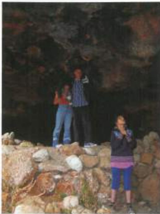
Spoznavali "morske" jame.