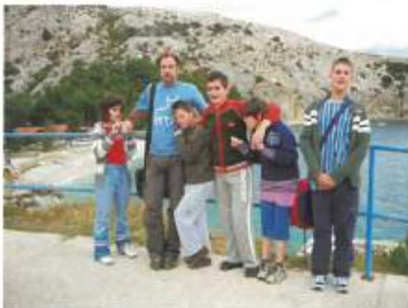
Čeprav vreme ni bilo za kopanje, smo teden preživeli zelo razgibano. Se že veselimo naslednjega dopusta!