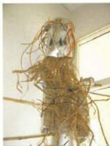
Skulptura: Človek prihodnosti