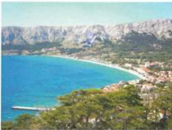
Se povzpeli na najvišjo točko nad Baško.