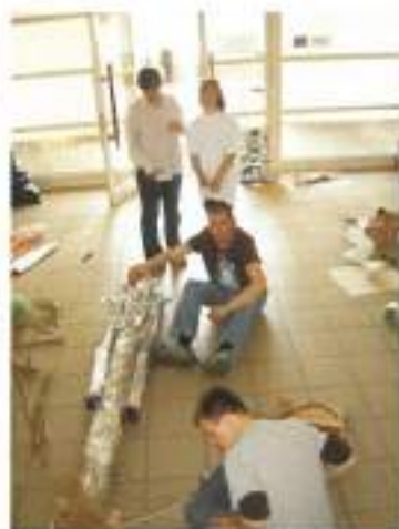
Med izdelavo skulpture