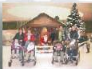
Obisk Božičkove dežele v City parku Ljubljana...