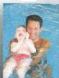
Vodni ples v dvoje...