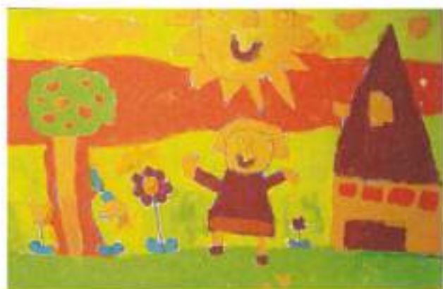
Avtor: Maja Goleš