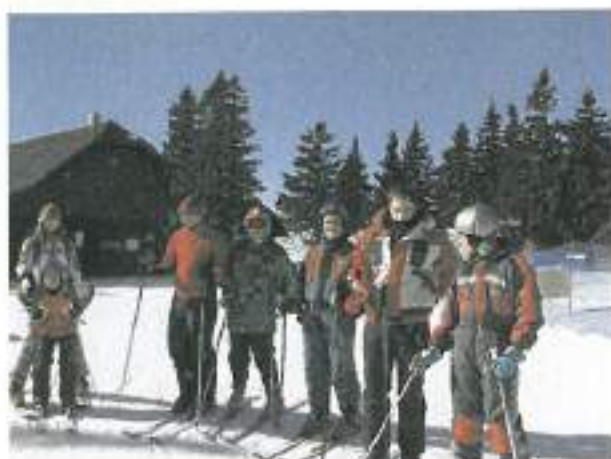
Nekateri so se odpravili na smuko