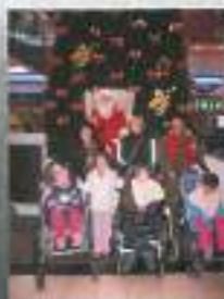
Mrzlični prednovoletni nakupi v City centru Celje...