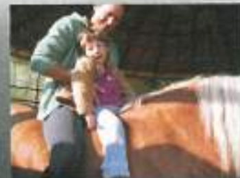
Moj rjavi konj ne rabi uzde...