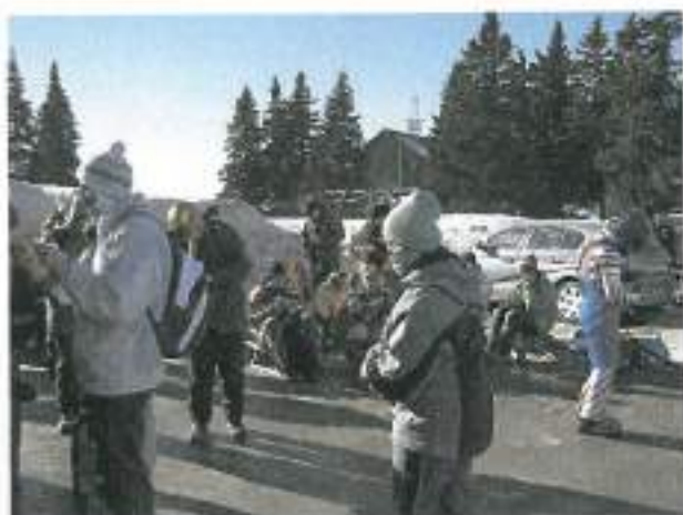
Ob prihodu na Roglo smo najprej malicali.