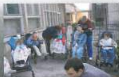
Kostanjevci piknik (jesen 2007)