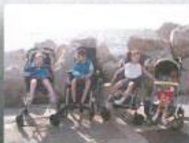
Pomorščaki v Piranu