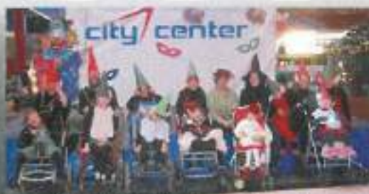
Škratinje in škrti na pustovanju