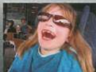
Veliko smeha v Kopru