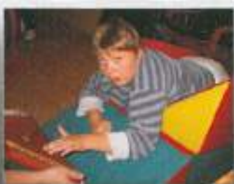
Mladi virtuoz na citrah