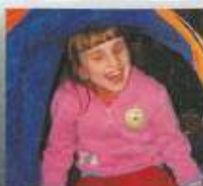
Takole se zabavamo v trebuhu gosenice