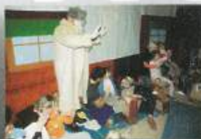
Po igrici Pismo stricu nas je obiskal dedek Mraz...