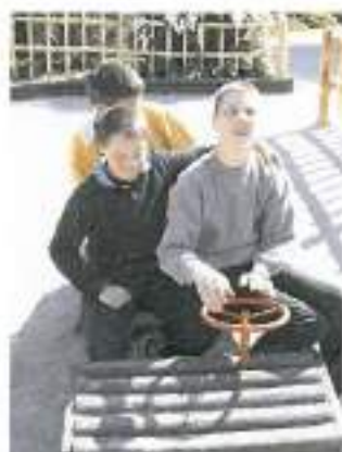
Kam nas boš pa sedaj odpeljal?