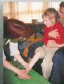
Ponosni smo na rezultate našega ustvarjanja...