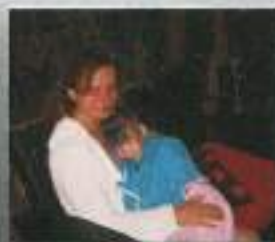
Morski deklici v Portorožu