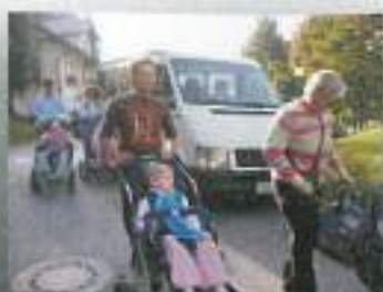
Na poti v Terme Dobrna...