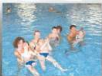
Uživanje v hidrotterapiji