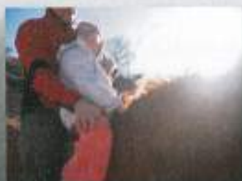
Varna v rokah svojega hipoterapevta...