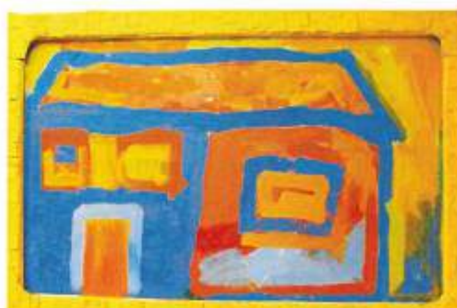
Avtor: Polona Janžič