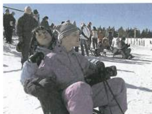
Nekateri pa veselo na sanke.