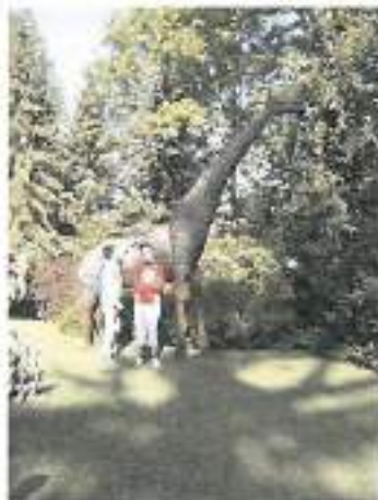
Je to res žirafa?