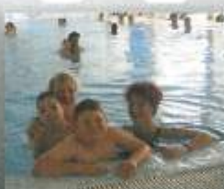
Četvorka v bazenu