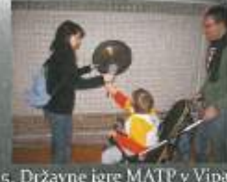
5. Državne igre MATP v Vipavi (november 2007)