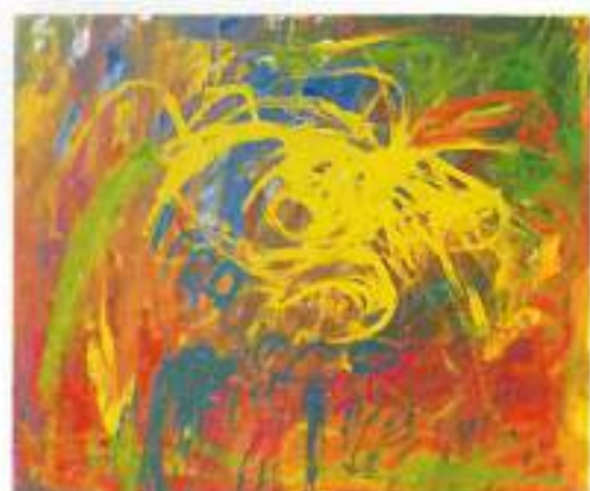
Avtor: Tadej Perc