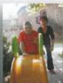
Kaskaderski podvigi na toboganu