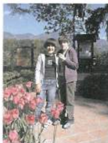
Rožici iz skupine OVI III med tulipani