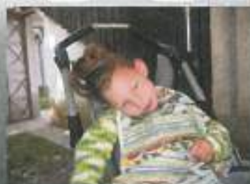
Ko sem z vsem zadovoljna