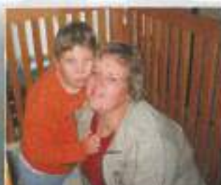
Midva sva najboljši par