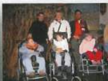
V džungli se marsikaj dogaja...