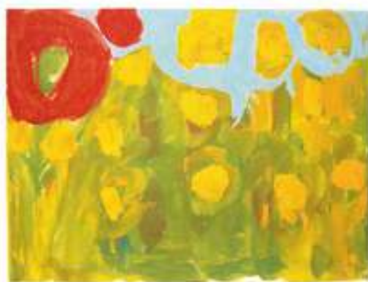
Avtor: Nina Majcenovič