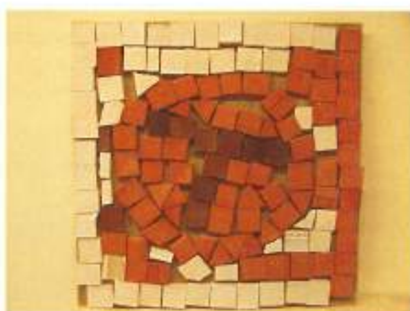
Avtor: Jernej Jakopič