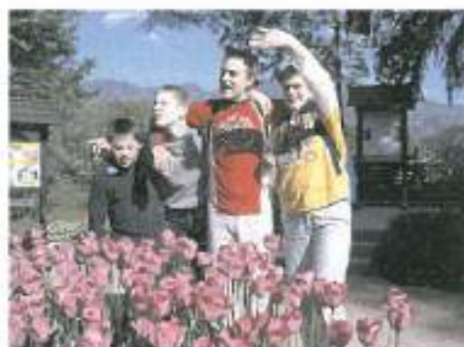
Fantje iz skupine OVI III

NA VRTU ROŽICA RDEČA CVETI, SONČEK JO GREJE, SE SLADKO SMEJI. METULJČEK K ROŽICI PRILETI, KER ROŽICA TAKO LEPO DIŠI. SKUPAJ SE LEPO IMATA, SMEJETA SE, POJETA IN IGRATA. PRIJATELJA STA RES PRAVA, KO SI Z NJIMA, JE ZABAVA.