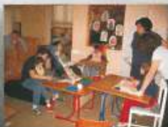
Naši ustvarjalni dnevi...