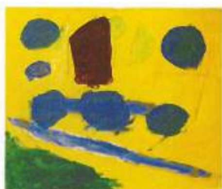
Avtor: Gabrijela Lampret