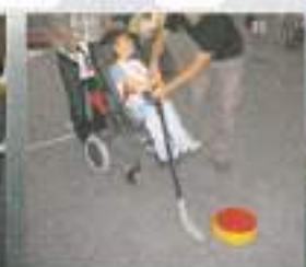
Priprave za slovensko hokejsko reprezentanco...